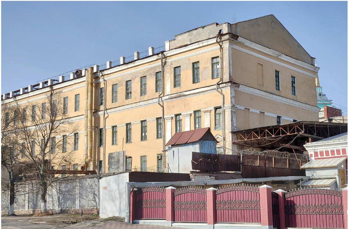
Фото 3. Фрагмент бокового (юго-восточного) фасада и южная часть юго-западного фасада Объекта. Вид с южной стороны.