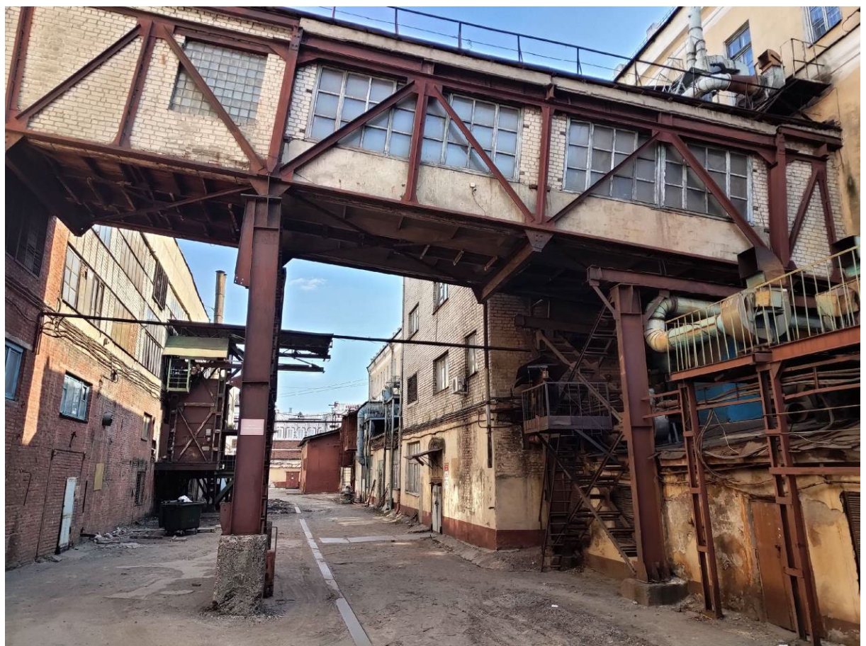
Фото 4. Фрагмент северо-восточного фасада Объекта. Вид с восточной стороны.