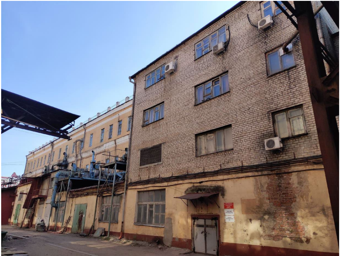
Фото 5. Фрагмент северо-восточного фасада Объекта. Вид с восточной стороны.