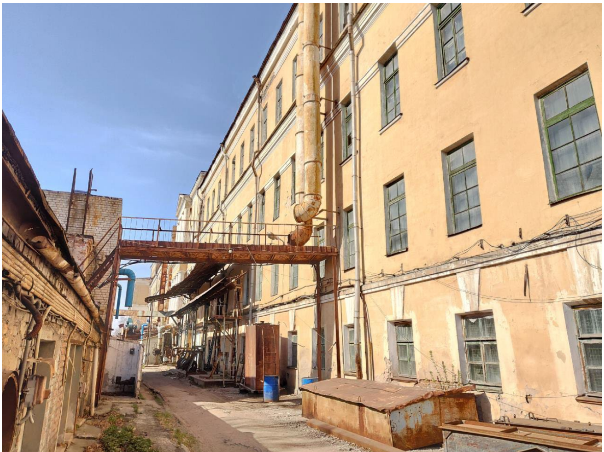
Фото 6. Фрагмент юго-западного фасада Объекта. Вид с южной стороны.