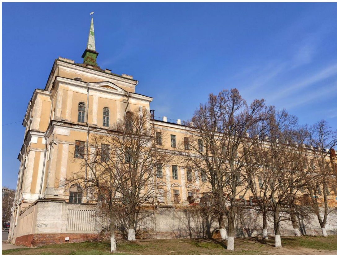
Фото 1. Северная часть юго-западного фасада Объекта. Вид с западной стороны.